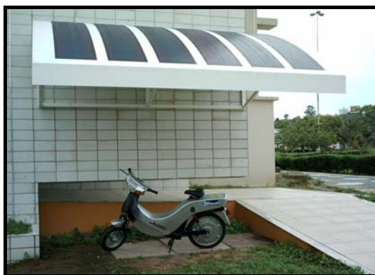
Figura 3 - Posto de Energia Solar, com painel fotovoltaico composto por 6 módulos flexíveis, de filme fino de silício amorfo, e a motocicleta elétrica Mobilec .

O painel é composto por 6 módulos flexíveis de 64W, de filme fino de silício amorfo (a-Si), junção tripla ( Uni-Solar , modelo PVL-64). A energia gerada é levada a um controlador de carga (Unitron, modelo LVD 12), cuja função é gerenciar o processo de carga e flutuação das baterias, de modo a maximizar a vida útil das mesmas. O banco de baterias é constituído por 8 baterias de 12 V, cada uma com capacidade nominal de 220 Ah (Moura, modelo Clean ). A energia gerada pelo painel é armazenada no banco de baterias, cuja carga é monitorada pelo controlador de carga. Quando necessário, a energia é transferida para as baterias da motocicleta por meio de uma tomada com cabo apropriado, localizado sob a cobertura do Posto Solar, à semelhança de um posto de abastecimento de combustíveis convencional. O processo de certificação verde pelo sistema LEED , referido em 2.2, poderia receber pontuação adicional pelo fato do edifício prover uma tomada destinada a reabastecer veículo elétrico.