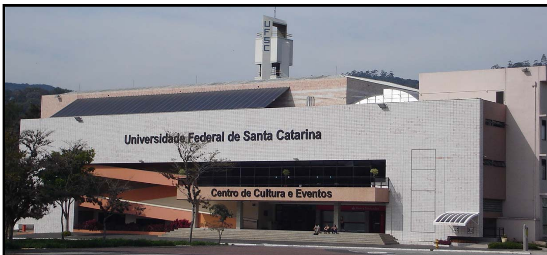
Figura 1 - Vista da fachada do Centro de Eventos, com o painel do sistema fotovoltaico de 10,24kWp instalado na cobertura, com inclinação de 27°.

A área ocupada pelo painel do sistema, de 173 m 2 , corresponde a apenas 7,6% da área total disponível na cobertura. A energia gerada pelo sistema é injetada diretamente na rede elétrica e utilizada pelos equipamentos elétricos do prédio. A alimentação elétrica do prédio está dividida em dois circuitos: um para o condicionamento de ar e outro para o restante do prédio. O consumo do prédio, excetuando o consumo do ar condicionado, permitiu estimar um valor de consumo diário médio igual a 473,28 kWh e um consumo anual médio de 172.747,2 kWh. Os medidores do sistema registraram uma geração total de 13.585 kWh no primeiro ano de operação e 14.365 kWh no segundo ano. O total gerado durante os 2 anos é de 27.950 kWh, o que permite estimar uma geração média mensal de 1.164,58kWh, correspondente a 7,9% do consumo médio mensal estimado para o prédio. (VIANA e RÜTHER, 2007).