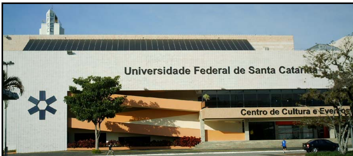
Figura 6 - Painel fotovoltaico do sistema de iluminação de emergência, com forma alusiva à imagem tradicional do Sol, integrado à fachada norte do prédio do Centro de Eventos.

O banco de baterias foi dimensionado inicialmente para fornecer energia pelo período de 1 hora, que é a autonomia especificada pela norma NBR 10898 - Sistema de Iluminação de Emergência (ABNT, 1999). Considerou-se que, durante este período, o banco deverá atingir profundidade de descarga de 20%, e fornecer energia igual a 440Wh, necessária para alimentar os 4 (quatro) pontos de luz, com 2 (duas) lâmpadas halógenas de 55W. O banco de baterias instalado apresenta o dobro da capacidade calculada inicialmente, visando dar maior garantia ao sistema.