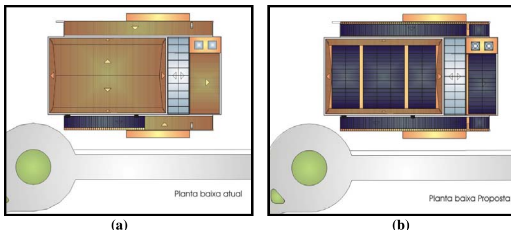
Figura 2 - Estudos da cobertura mostrando (a) a área ocupada pelo painel fotovoltaico atual e (b) a distribuição para ocupar praticamente toda a cobertura.

A tecnologia empregada no sistema atual é a de filme fino de silício amorfo (a-Si), de junção tripla, com eficiência nominal de 6,0% e coeficiente de temperatura para potência ( T_{P\ COEF} ) desprezível (RÜTHER e DACOREGIO, 2000).